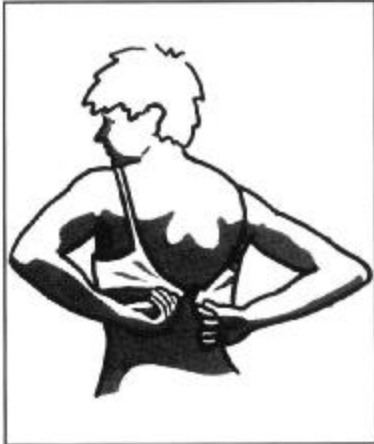
Figuur 4: MAAR ZO! Van achteren vastmaken.