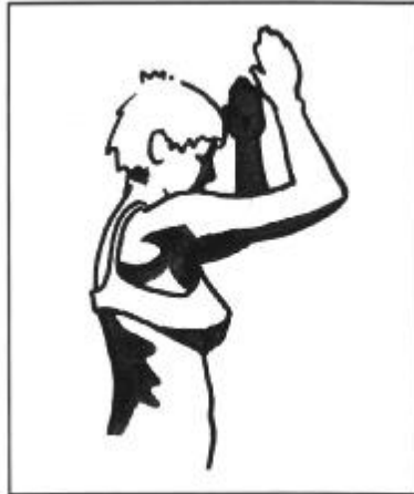
Figuur 2: Beha kruipt van achteren omhoog: weg ondersteuning!