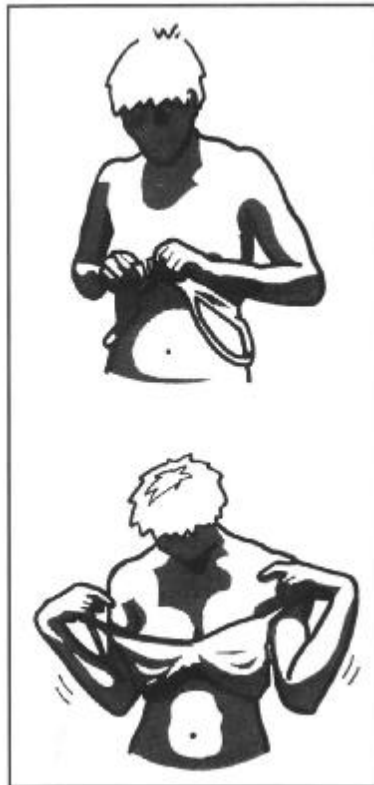
Figuur 3: Van voren vastmaken, ronddraaien zodat de sluiting op de rug komt, en schouderbandjes omdoen. NIET ZO!